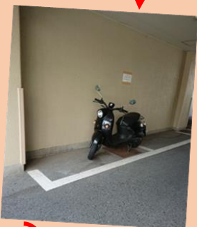
隙間を利用した バイク置き場 を通ると、