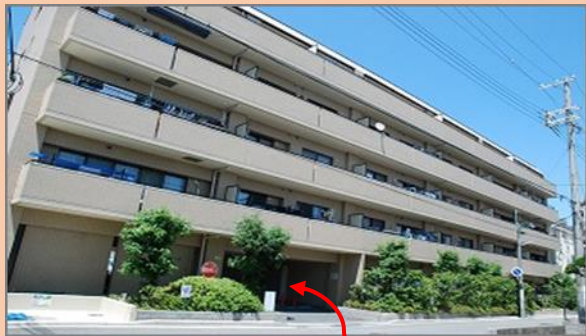
マンション入り口