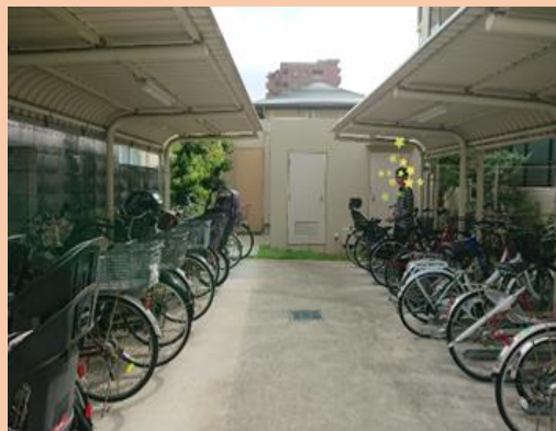
駐輪場奥に見える扉が集会室！