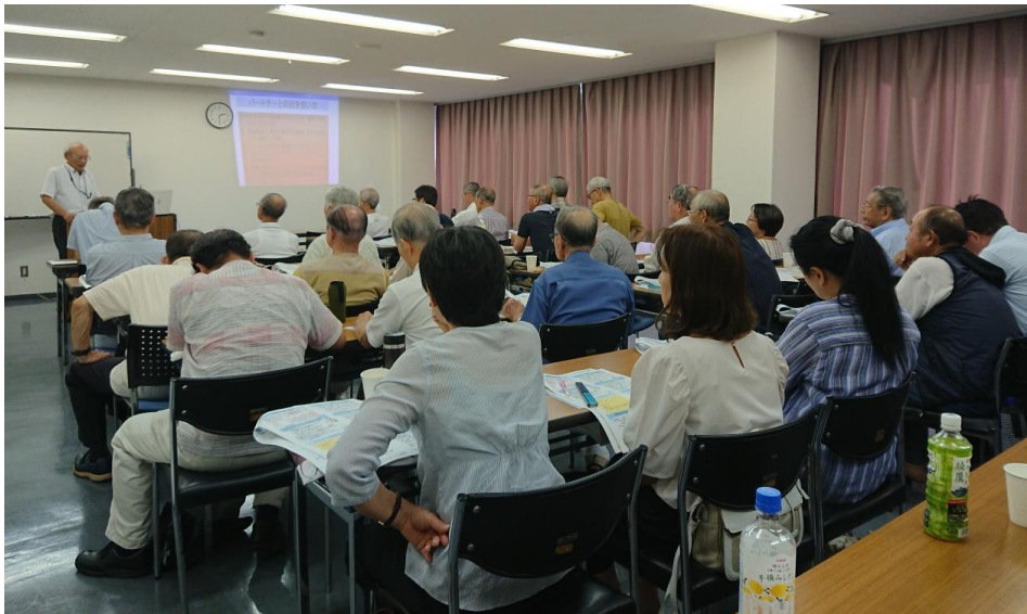
「大規模修繕工事、何から手をつける？」 暑い～～！！大盛況(^^)/